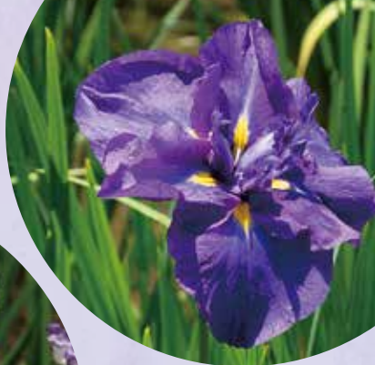
外国系(アメリカ品種)