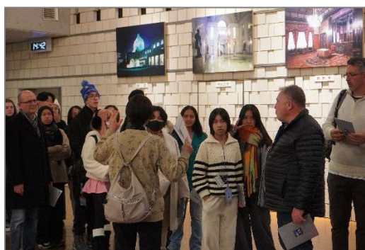
令和5年度ベルモント市学生の受け入れ