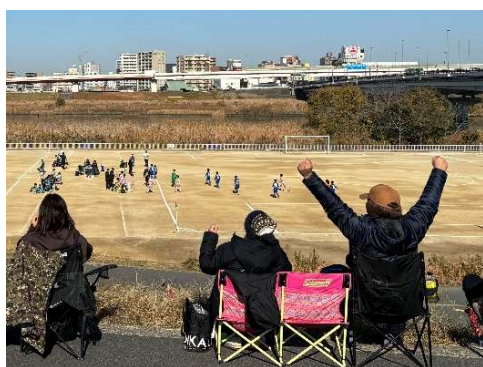
グランプリ「勝った～」