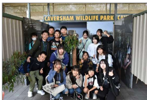
令和6年度ベルモント市への学生使節団派遣