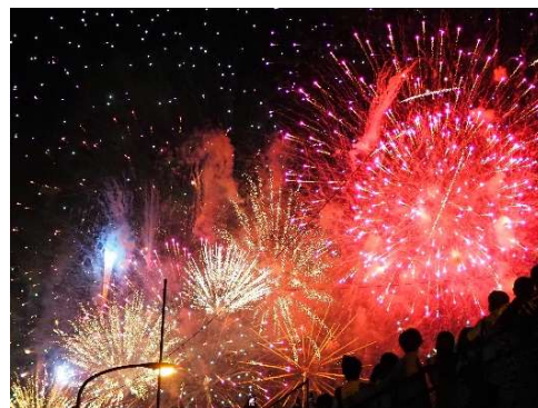
準グランプリ「花火」