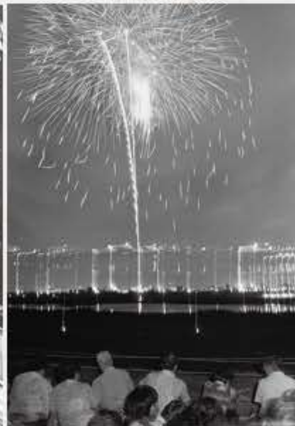
写真：第1回花火大会(昭和50年代)