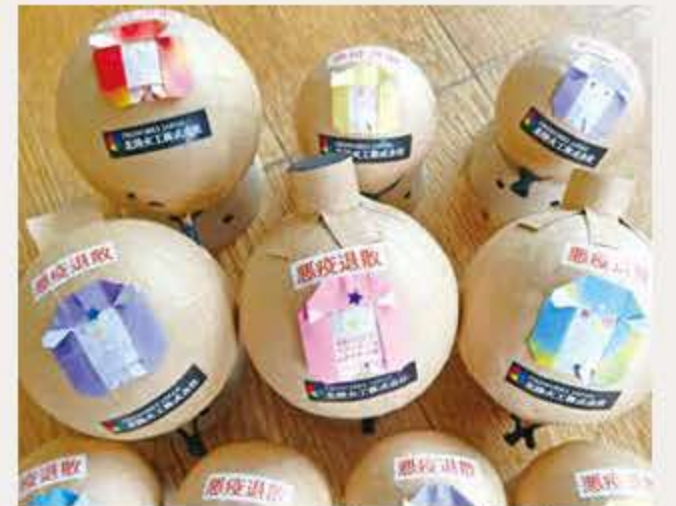
写真：アマビエの折紙を貼った願い玉