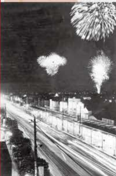
写真：名物千住の花火(昭和20年代) 足立区立郷土博物館所蔵