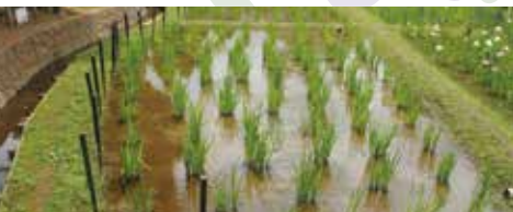
株分け後1年が経過したしょうぶ田

ハナショウブ(アヤメ科)は、江戸時代後期(1800年代)から続く日本の伝統園芸植物のひとつで、紫や薄紫、黄色や白など、色とりどりの美しい花姿が楽しめます。ここ、しょうぶ沼公園では、花の形や模様を見比べながら鑑賞できるよう、ハナショウブを「列植え」にしており、約140品種、約8100株が皆さまをお迎えます。