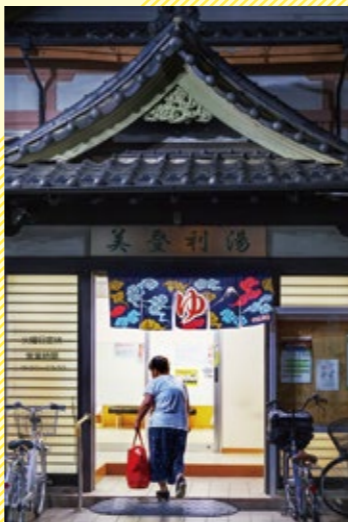
第6回 足立区街フォトコンテスト グランプリ 「今日もご苦労様でした」

お問い合わせコール あだち 03-3880-0039 FAX 03-3880-0041 午前8時から午後8時まで(1月1日から3日を除く) 24時間受付