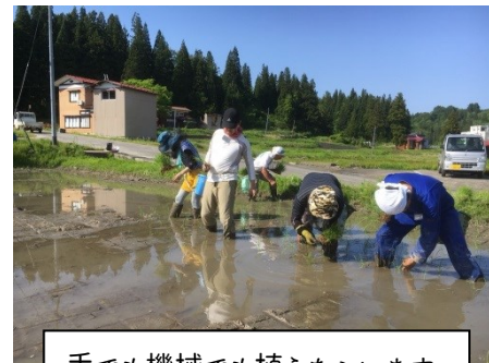
手でも機械でも植えちゃいます

【持ち物】作業着(長袖),長靴,帽子,手袋,雨具,上着,着替え,虫よけ, 健康保険証など