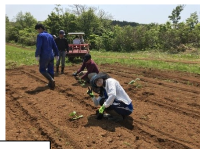
少しのお勉強と、畑での野菜作りもやります