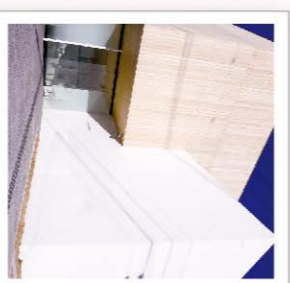
▲造形及び環境設計に優れたデザインが魅力的

六町コミュニティセンター 六町二丁目 5-35 🚶 つくばエクスプレス六町駅 徒歩五分 📅 平成24年6月にオープンした美術館です。日本画を中心に洋画を含め約350点を所蔵し、季節ごとにそれぞれの「四季」をテーマに展示をおこなっています。